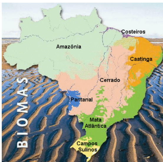
Biomias do Brasil

Será que no computo da área de reserva legal, de 812,911 hectares não foram incluídas áreas correspondentes às Áreas de Preservação Permanente – APPs ? Foi solicitada alguma perícia nesse sentido?